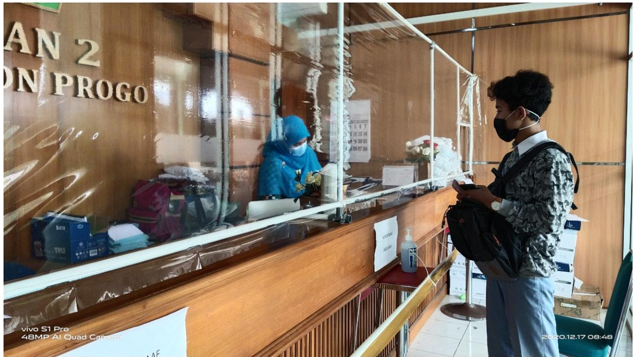
Foto 4 Petugas PTSP MAN 2 Kulon Progo sedang melayani pembayaran siswa